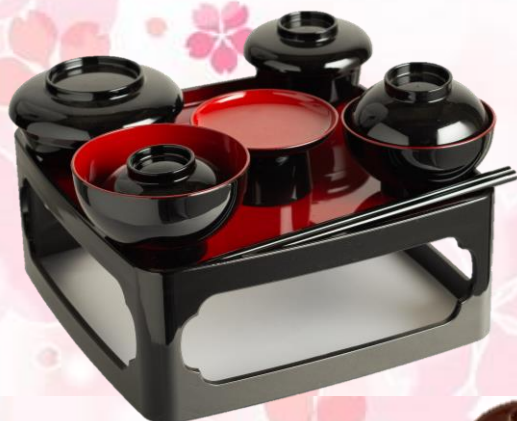
34 仏膳 7 寸