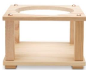
木製花瓶台 大 サイズ：W23×D23×H13 up18cm