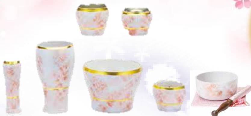
(花立、火立、香炉、仏器、茶湯器、線香差し)