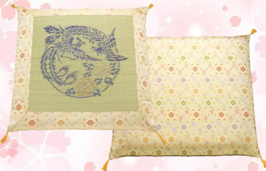
77 葵 鳳凰 コンパクトサイズ（67cm）