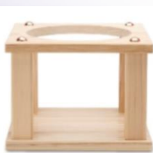
木製花瓶台 中 サイズ：W18×D18×H12 up13cm