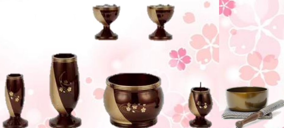
(花立、火立、香炉、仏器、茶湯器、線香差し)