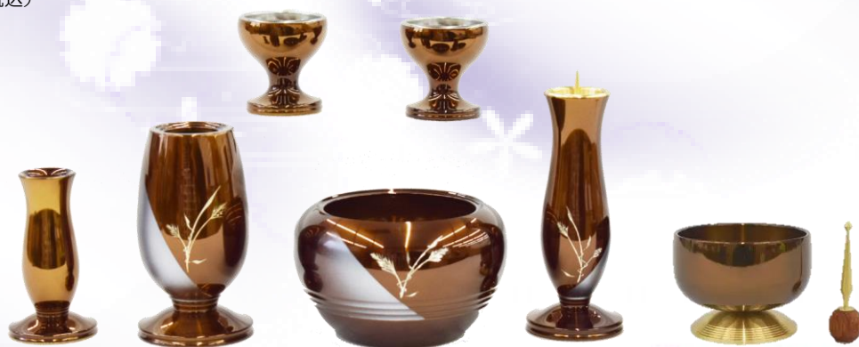
(花立、火立、香炉、仏器、茶湯器、線香差し)