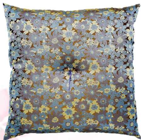
75 フラワーチャコールグレー