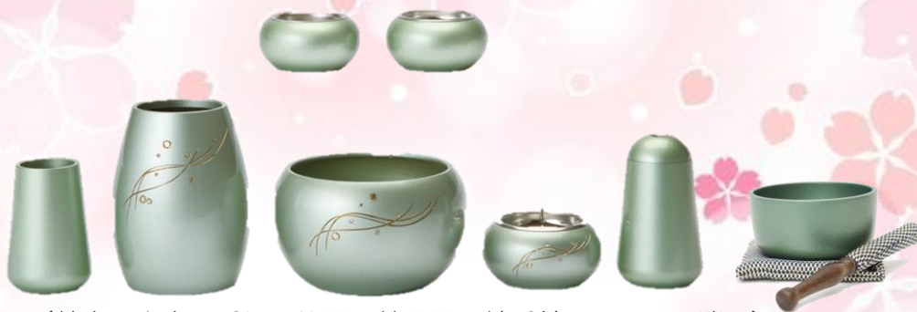
(花立、火立、香炉、仏器、茶湯器、線香差し、マッチ消し) 風美月セット 6具足セット (セピア)