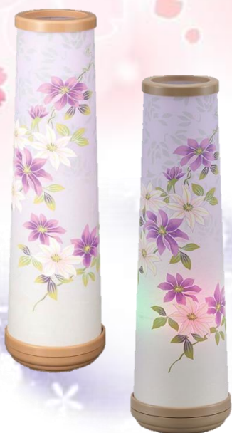
24 和花 点灯時