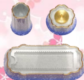
桜型の模様となります