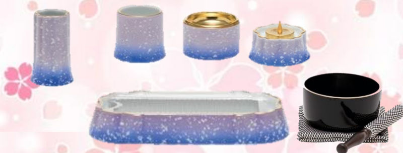
(火立、寝香炉、仏器、茶湯器、線香差し)