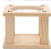
木製花瓶台 小 サイズ：W14×D14×H10 up10cm

金彩雲海 投入【2個】 (約 高 30 cm 直径 12cm) 会員価格 (消費税込) 13,000 円 消費税 1,182 円 一般価格 16,000 円