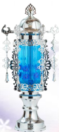
27 バブル プラチナ